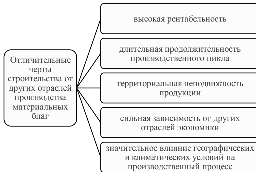
Рис. 1. Отличительные черты строительства от иных отраслей производства материальных благ

Строительный комплекс состоит из совокупности проектных и подрядных организаций, производств строительных материалов, конструкций и домокомплектов, а также поставщиков оборудования и строительных материалов. В данном комплексе создаются и направляются инвестиции в развитие основных производственных фондов. Он характеризуется гибкостью, которая заключается в способности быстро трансформировать технологии производства и методы ведения работ, принятия управленческих решений. Управление основывается на постоянном мониторинге ситуационной обстановки и выборе оптимального решения из множества неопределенностей [2].